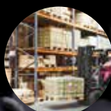
LOGISTIQUE ET ENTREPOSAGE